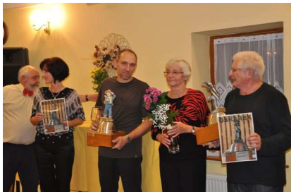
Vítězové minulého ročníku