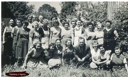
Historická fotografie kolektivu z továrny