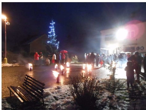
Účast byla, i přes nepřízeň počasí, hojná.