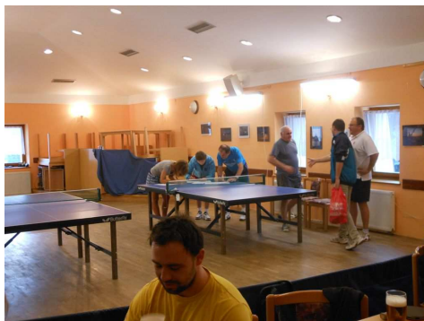
Velmi oblíbený turnaj.