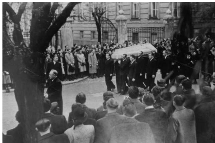
Pohřeb Jana Opletala.

ÚSČS (Ústřední svaz československého studentstva) vyvíjel Spomoci naší exilové vlády aktivní činnost, jejímž vyvrcholením byla londýnská schůze Mezinárodní studentské rady v roce 1941, která vyhlásila 17. listopad Mezinárodním dnem studentstva.