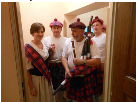
Vystoupení skotů s dudami.