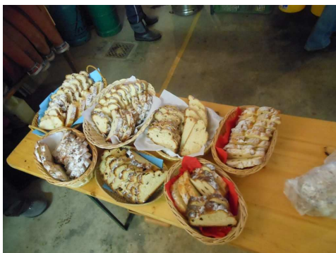
Podávala se vynikající vánočka.