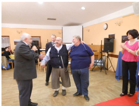
Panovała zde přátelská atmosféra.