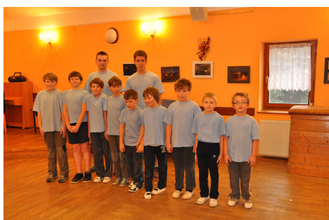
Cvičící mládež.