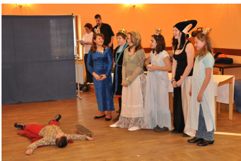
Divadelní vystoupení.