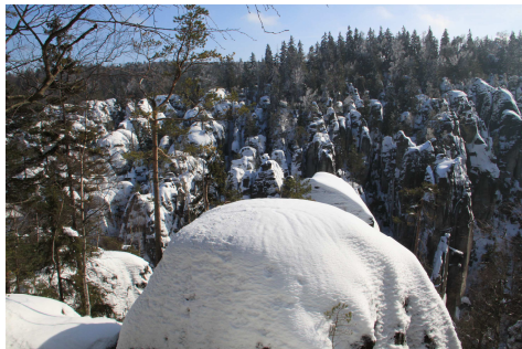
Teplícké skály.