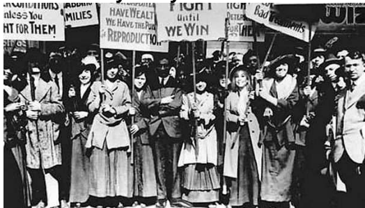
Stávka newyorských švadlen.