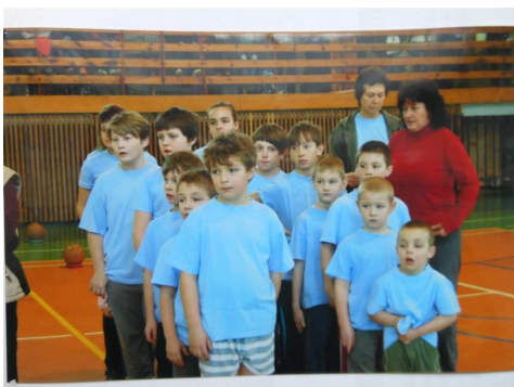
Naši reprezentanti.