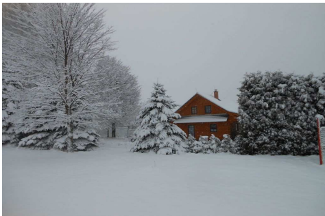
Příchod „jara“ do Dolní Brusnice.